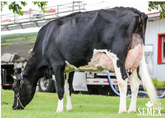
COMESTAR LAUHALI LAUTRUST