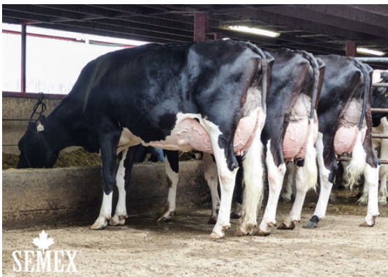
LAUTRUST DAUGHTER GROUP