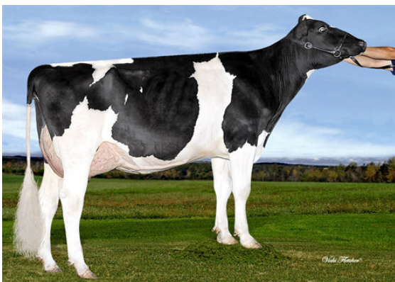
DUBONLAIT LAUTRUST GYPSY