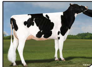
SYNERGY RUBICON PERFECT GP-84-2YR-USA 02-06 305 8342M 435F 5.2% 323P 3.9%