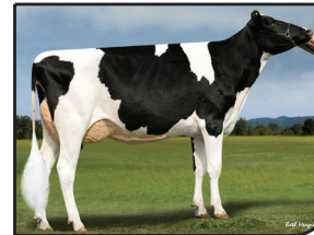
PROGENESIS DENVER OOBLECK GP-84-2YR-USA