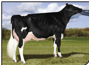
COOKIECUTTER MOM HALO VG-88-2YR-USA 02-00 305 14093M 729F 5.2% 510P 3.6%