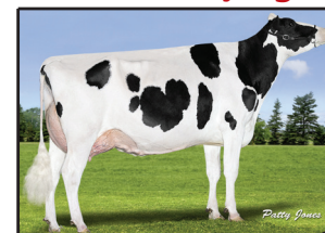
WALNUTLAWN MCCUTCHEN SUMMER EX-93-5YR-CAN EX-92-3YR-USA 3*(0/17) 01-10 305 10438M 476F 4.6% 336P 3.2%