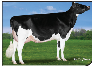
CLAYNOOK DIVINITY UNIX VG-88-3YR-CAN 03-04 305 12151M 615F 5.1% 467P 3.8%