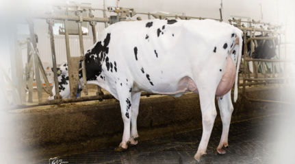
File : PREROSS KNOWHOW SÉMIRA TB-86-3A-CAN