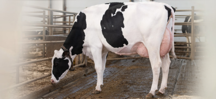
File : RIVERDOWN KNOWHOW JIGGAFUN TB-86-3A-CAN