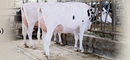
Filles : (gauche) CAMPAGNA KNOWHOW RUBY TB-87-3A-CAN (droite) CAMPAGNA KNOWHOW BARBARA TB-85-2A-CAN

Fertilité de la semence +64 Fertilité de la semence +63 Fertilité de la semence +64 Fertilité de la semence +63