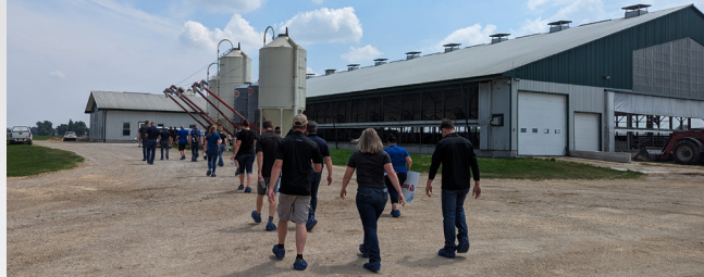
Photo du haut : les participants à la rencontre se sont réunis à Larenwood Farms Ltd., Drumbo, Ont. Milieu: Visite de Hoenhorst Farms Ltd., Innerkip, Ont. Bas : MB-Luckylady Bullseye en démonstration à Semex.